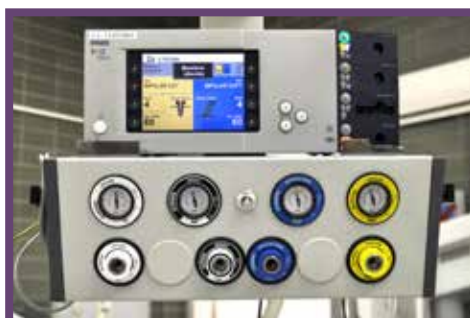
Přístroj pro stavění krvácení