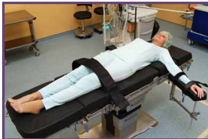
Základní poloha u ORL operací

Operace jsou prováděny v celkové anestézii.