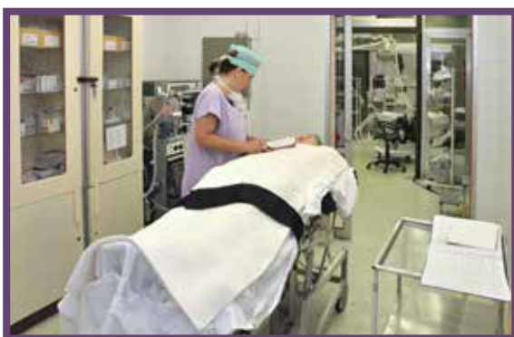
Anesteziologická přípravna u operačního sálu