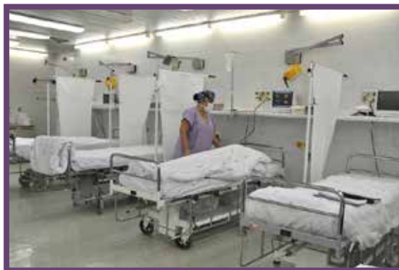
Dospávací pokoj na COS I

Po souhlasu anesteziologického lékaře budete přeloženi na lůžko. Lékaři a sestry z ORL kliniky Vás převezou na jednotku intenzivní péče (pooperační pokoj) nebo standardní oddělení, ze kterého jste byli odvezeni na operační sál.