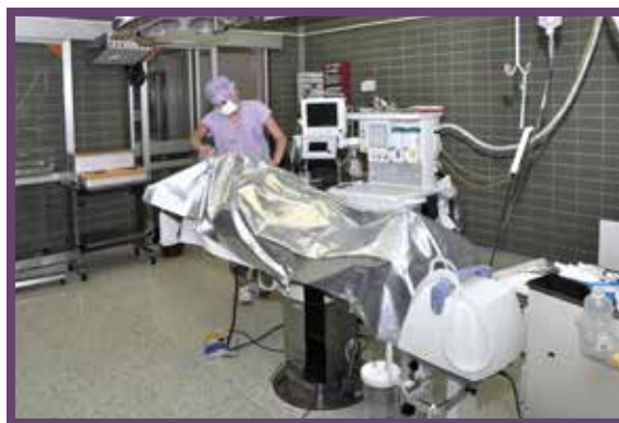
Operační sál pro operace ORL

Po úvodu do anestézie Vás personál uloží do polohy nutné k operačnímu výkonu.