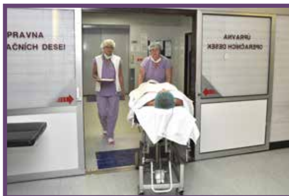
Převoz na anesteziologickou přípravnu u operačního sálu

Takto připravené Vás personál operačních sálů převezve na operační sál ORL dle rozpisu operačního programu.