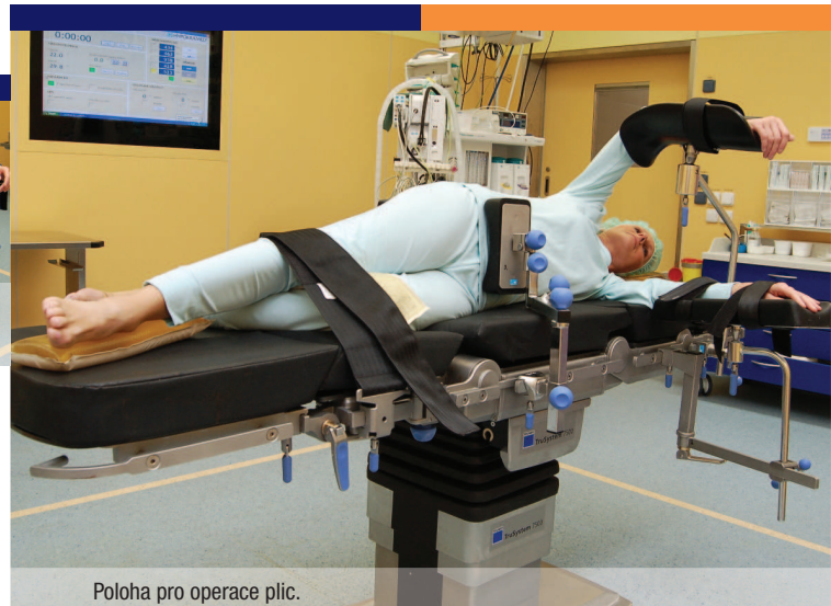
Poloha pro operace plic.

Operace jsou vedeny v celkové anestézii.