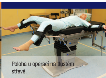
Poloha u operací na tlustém střevě.

Operace jsou vedeny většinou v celkové anestézii. Na konečníku mohou být prováděny i ve svodné anestézii.