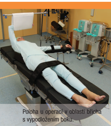
Poloha u operací v oblasti břicha s vypodložením boku.