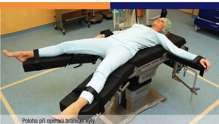
Poloha při operaci brániční kýly.

Operace jsou vedeny v celkové anestézii. Poloha většinou bývá na zádech, popř. s roztaženými dolními končetinami a vypodložením boku.