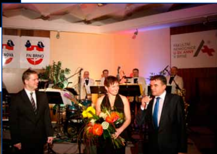
▲ Dne 6. února 2010 se konal III. společný reprezentační ples FN u sv. Anny a FN Brno

Od 15. února 2010 používá FN Brno nový znak a vizuální styl