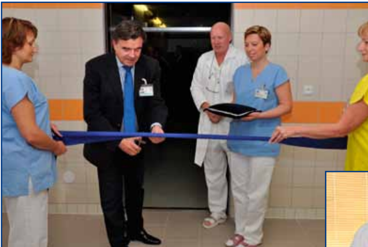
▲ Dne 21. října 2010 byla slavnostně otevřena zrekonstruovaná část Centrální sterilizace, PMDV