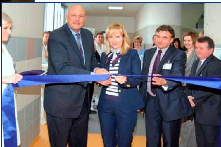
▲ Dne 7. května 2010 byla slavnostně otevřena Spinální jednotka FN Brno