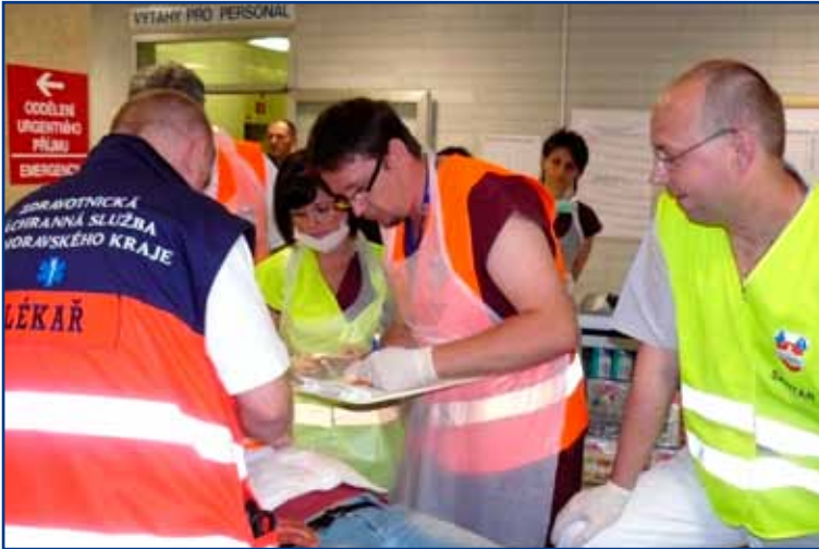
▲ Dne 15. června 2010 se FN Brno podílela na cvičení TRAUMA 2010