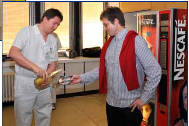
▲ Dne 21. prosince 2010 bylo pokřtěno DVD Průvodce porodem ve FN Brno