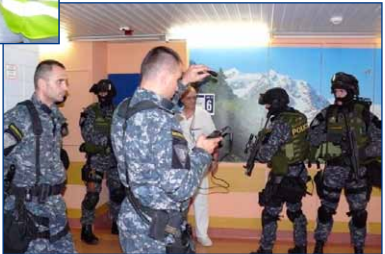
▲ Dne 18. října 2010 se uskutečnilo cvičení zásahové jednotky Policie ČR