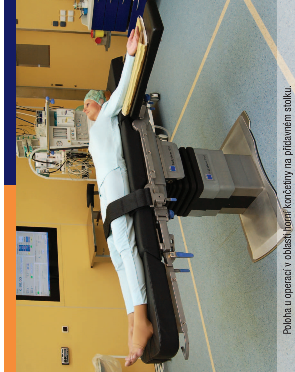
Poloha u operací v oblasti horní končetiny na přidávném stolku.

Operace jsou vedeny většinou v celkové anestézii.