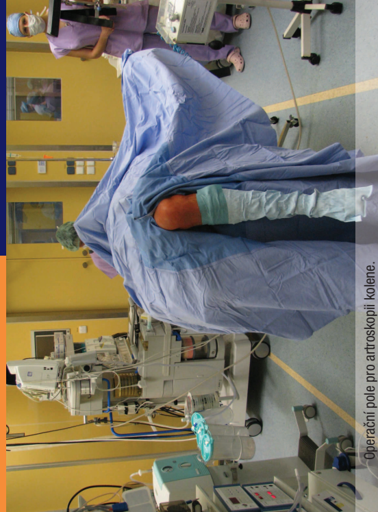
Operační pole pro arthroscopii kolene.

Poloha bývá na zádech, obě dolní končetiny spuštěny dolů, operovaná končetina zabezpečena v úchytech.