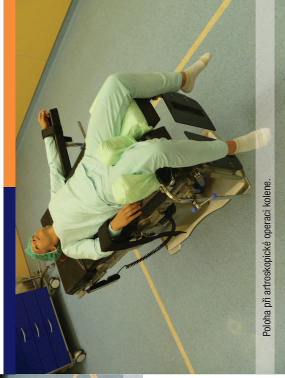
Poloha při arthroscopické operaci kolene.